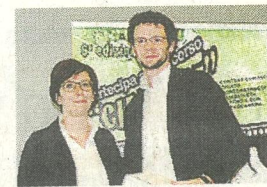
PREMIO DEL PUBBLICO MAURO LUCCA CIBO E...