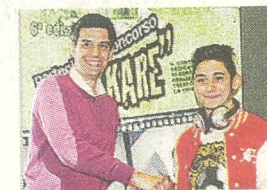
PREMIO DELLA CRITICA MATTIA ESPOSITO FOOD MUSIC